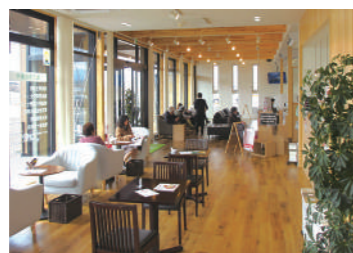
コミュニティスペースを併設した池田薬局こう店