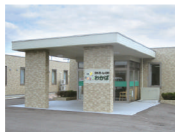
デイサービス・ショートステイわかば

秋田は高齢化日本一と言われてます。お年寄りにとって薬局も介護施設も身近なものでありますが、まだまだ元気な方も含め、地域の中で生活の不便や不安を抱える人達へ安心した暮らしを提供していきたい。私たちはそう考え、薬局での健康相談、栄養相談、介護相談の場をもっと広げていきたいと思っております。