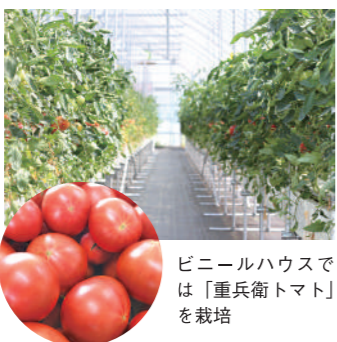
ビニールハウスでは「重兵衛トマト」を栽培