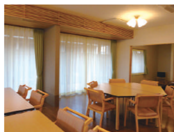
館内は広々とした明るい空間