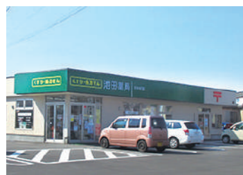
郵便局が隣接された池田薬局わかば店