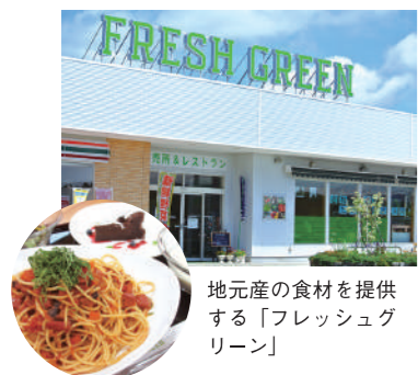
地元産の食材を提供する「フレッシュグリーン」

さらに野菜の直売所とレストランを運営し地域への配食サービスも開始。隣接するハウスでは、高糖度トマト「重兵衛」を栽培し、皆様に高い評価をいただいております。今年4月には管理栄養士を新たに2名増員し、地域で一人暮らしの方々に食と健康をお届けするサービスとして何が出来るかも考案しています。常に、地域における時代のニーズを捉えつつ、これからも、池田は安心・安全・安定した「健康・暮らし・食」を提供し続けていければと願っております。