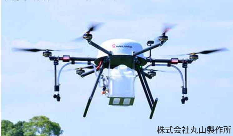
株式会社丸山製作所