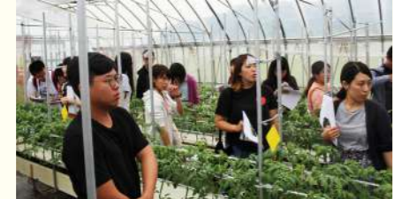
重兵衛トマトのハウスを見学中。