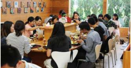
フレッシュグリーンでお食事をしました。

秋田県立大学の学生交流の一環として台湾の宜蘭大学生物資源学科の学生が重兵衛を訪問しました。最初に秋田スカイテックによる無人ヘリ・ドローンの説明、デモフライトを行い、(株)重兵衛では高糖度トマトの栽培システムを説明させて頂きました。沢山の質問をしてくださり、真剣で真面目な姿勢を見習いたいと思いました。台湾も日本と同じで農業人口の高齢化・減少が問題になっているそうです。そのような状況の中で、国を超えて農業について真剣に考える若者に会え、私も頑張ろうと感じました。