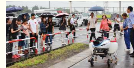
皆さん無人ヘリコプターに興味深々でした。

重 株式会社重兵衛 〒015-0065 秋田県由利本荘市荒町字真城79-1 TEL. 0184-74-6066 FAX. 0184-23-0197