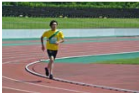
1回 1.4kmのコースを5分切り