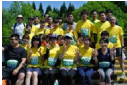
総勢35名で参加しました