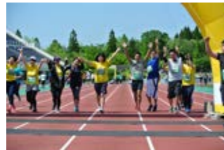
Team IKEDA! (先輩チーム) 皆でゴール