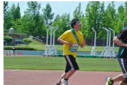
皆さん楽しく元気に走り切りました