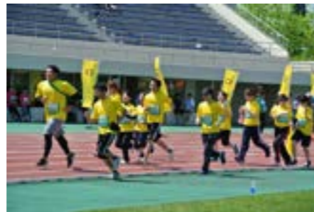
Team FRESH! のゴール