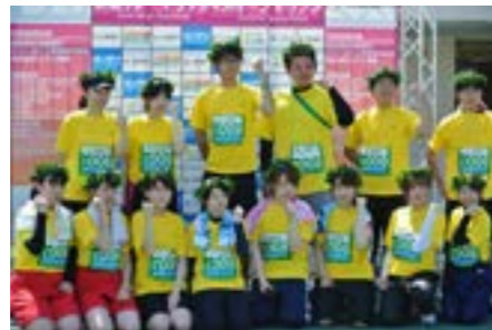
Team FRESH! (今年入社の新入社員)