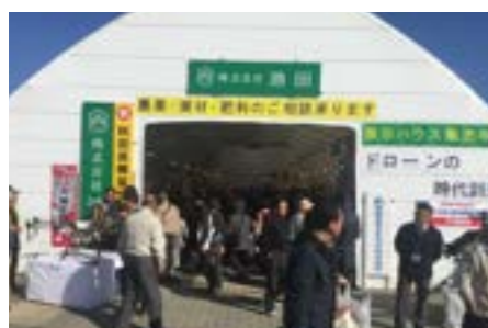
超大型パイプハウスを使用した池田ブース

今年の種苗交換会が10月30日～11月5日の7日間で開催され、弊社も出店させて頂きました。期間中、我々のブースに足を運んで下さった皆様には深く感謝申し上げます。今年は出展場所も良く、天気にも恵まれ大勢の方にご来場頂きました。その際「農業アンケート」の記入にご協力頂きました。これは生産者の皆様が実際に感じている事、問題や課題などをありのままに書いて頂き、今後の弊社営業マンに繋げるべく実施しました。皆様のご協力により、期間中 800 枚を超えるアンケートを頂きました。また、今回は「スマート農業」のような次世代農業に、関する新しいアイテムや「ドローン」「農業散布ポート」などの農業散布にも力を入れて展示しました。ご来場頂いた皆様の今後のご活躍に少しでもお役に立てて頂ければ幸いです。今後ともよろしくお願い致します。