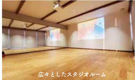
広々としたスタジオルーム