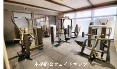
本格的なウェイトマシン