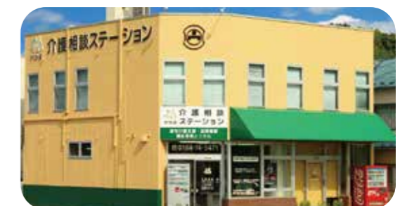
わかば介護相談ステーション